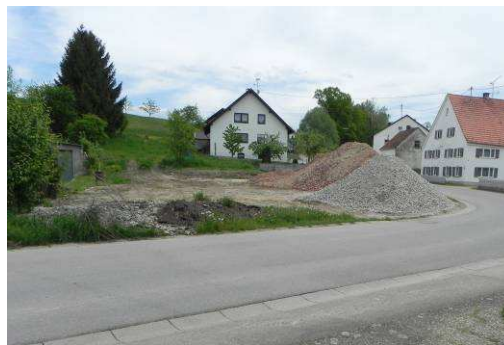
Ehemals Scheibenbergstraße 6 und die verbliebene Baulücke heute

Wichtig bei der Durchführung der Rahmenplanung sind vor allem die Einbeziehung sowie die Meinung der Bürger. Das Planungsbüro Daurer möchte deswegen die Eigentümer der im Bearbeitungsgebiet befindlichen Anwesen beraten, ggf. Entwicklungschancen aufzeigen. Voraussetzung ist, zu erfahren, was man in nächster Zeit mit seinen Grundstücken vorsieht. Will man beispielsweise ein Gebäude, das nicht für den Eigenbedarf genutzt wird, vermieten oder sogar verkaufen? Oder hat man ein sanierungsbedürftiges Gebäude, das sogar leer steht und weiß nicht, welche Nutzung evtl. dafür in Frage käme? Diese Fragen könnte man gemeinsam besprechen und in kleiner Runde Möglichkeiten diskutieren.